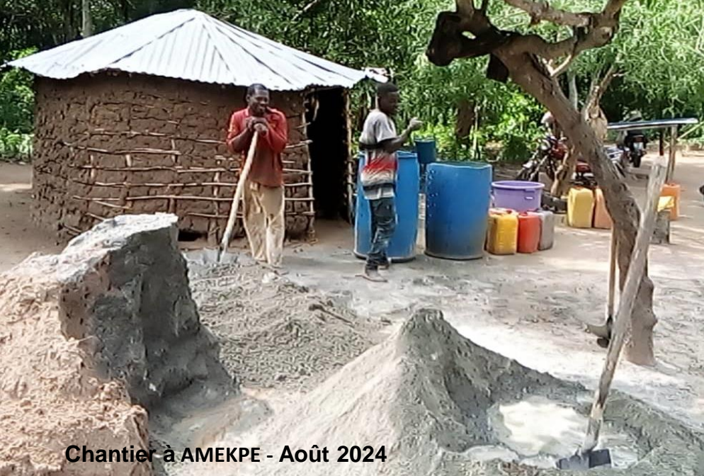
Chantier à AMEKPE - Août 2024

Samedi 23 novembre 2024 : confection de Bredeles à Westhouse