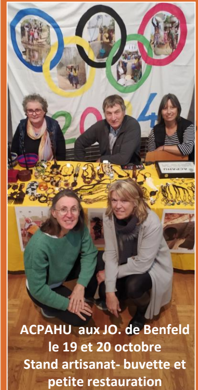
ACPAHU aux JO. de Benfeld le 19 et 20 octobre Stand artisanat- buvette et petite restauration

C'est dans ce cadre que le projet a été mis en place par l'Association Global Action de Développement