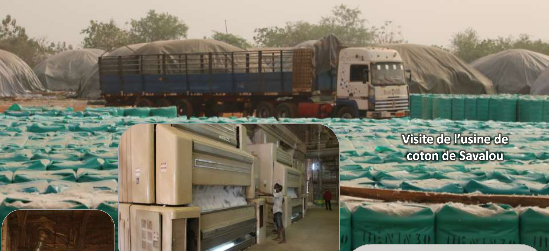
Visite de l'usine de coton de Savalou