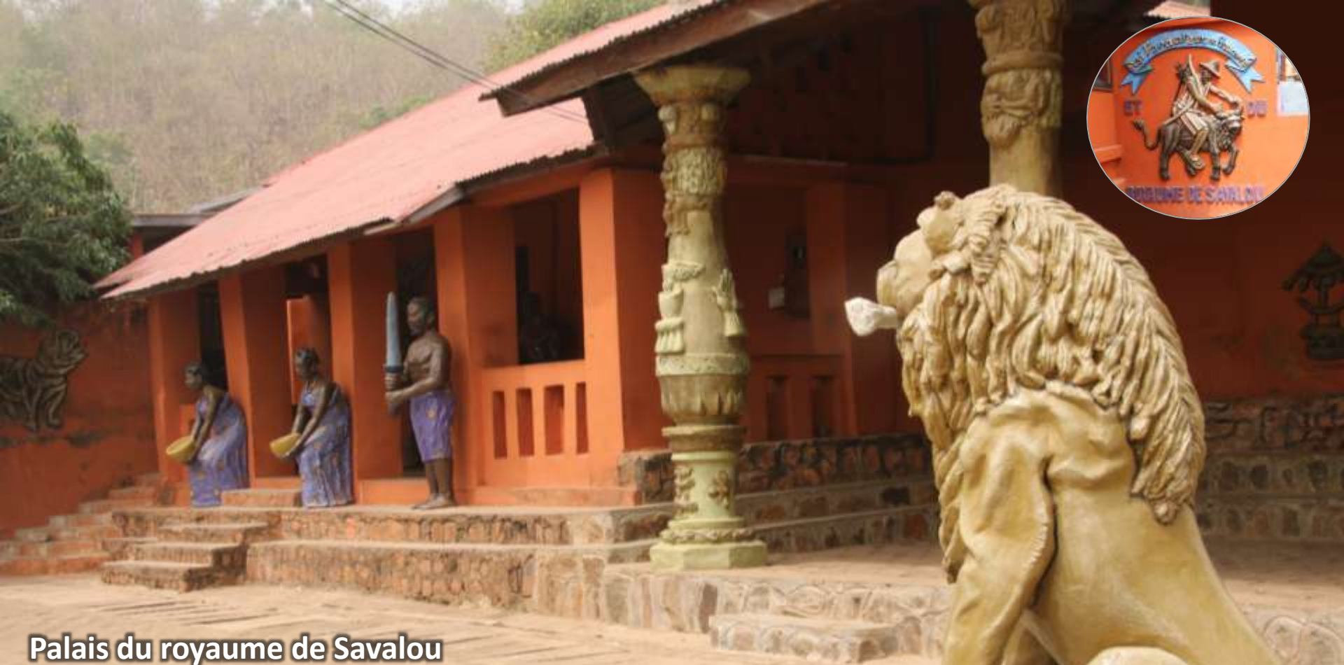
Palais du royaume de Savalou