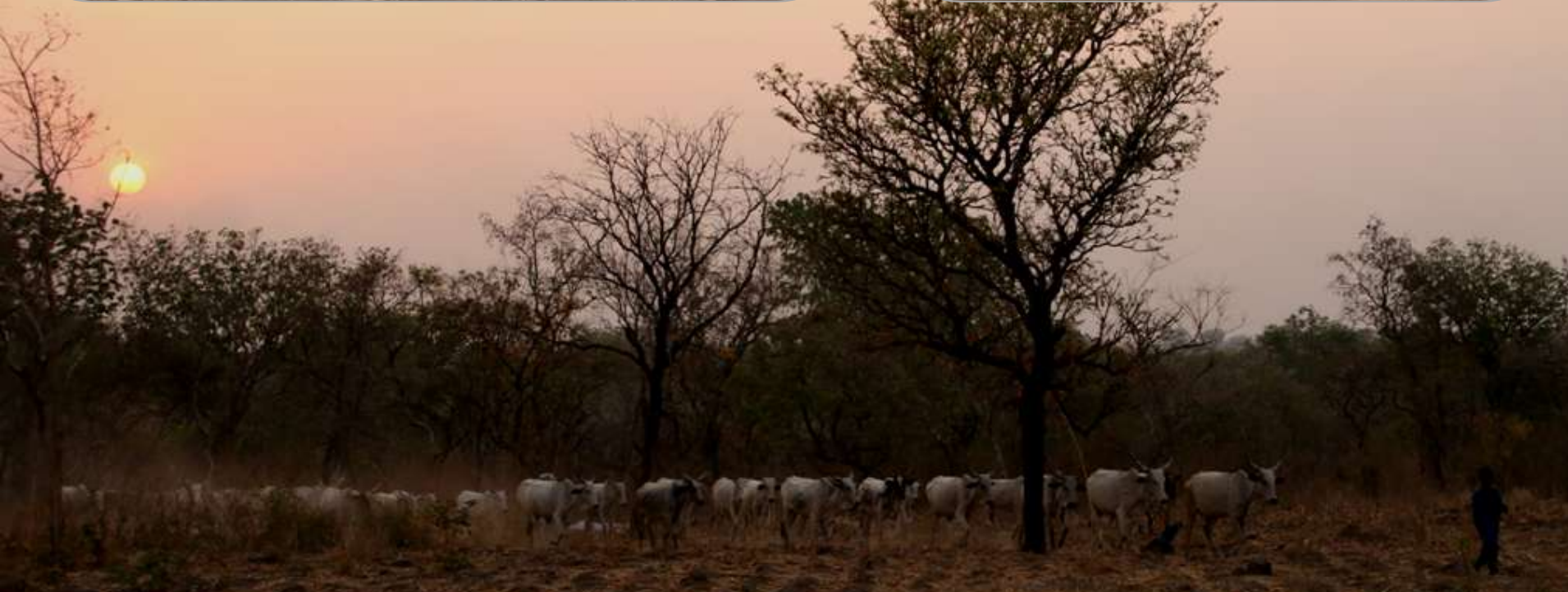
Prospection : soutien à la sédentarisation des nomades Peuls