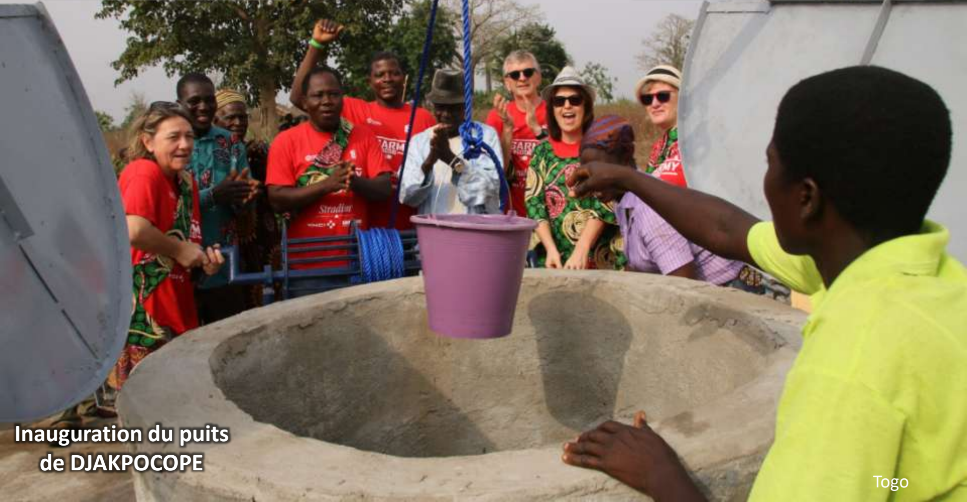
Inauguration du puits de DJAKPOCOPE