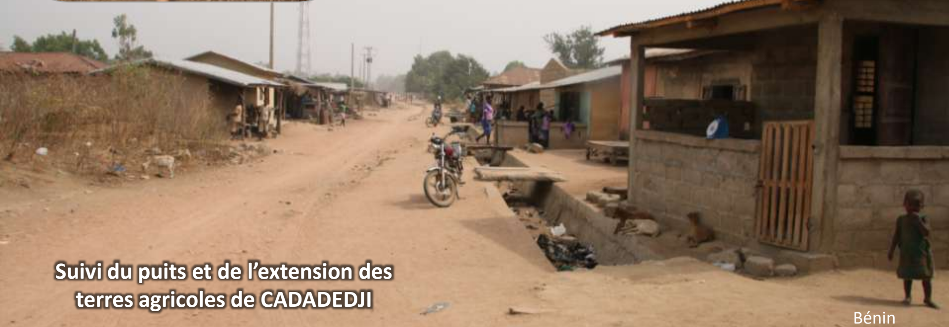
Suivi du puits et de l'extension des terres agricoles de CADADEDJI