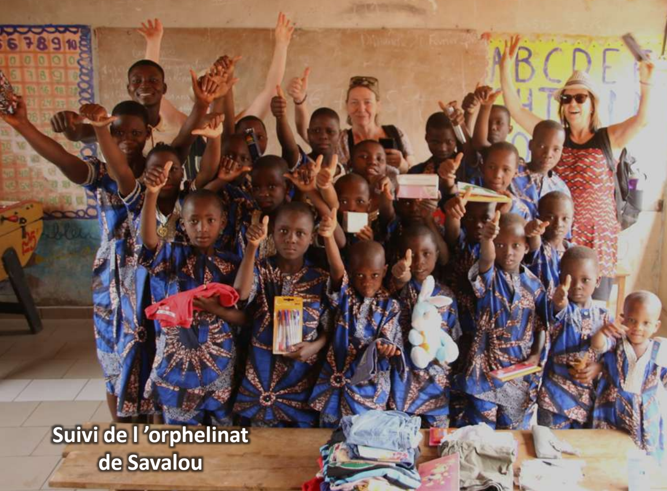
Suivi de l'orphelinat de Savalou