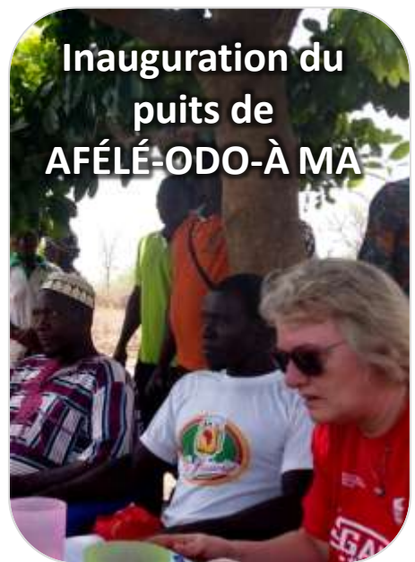
Inauguration du puits de AFÉLÉ-ODO-À MA