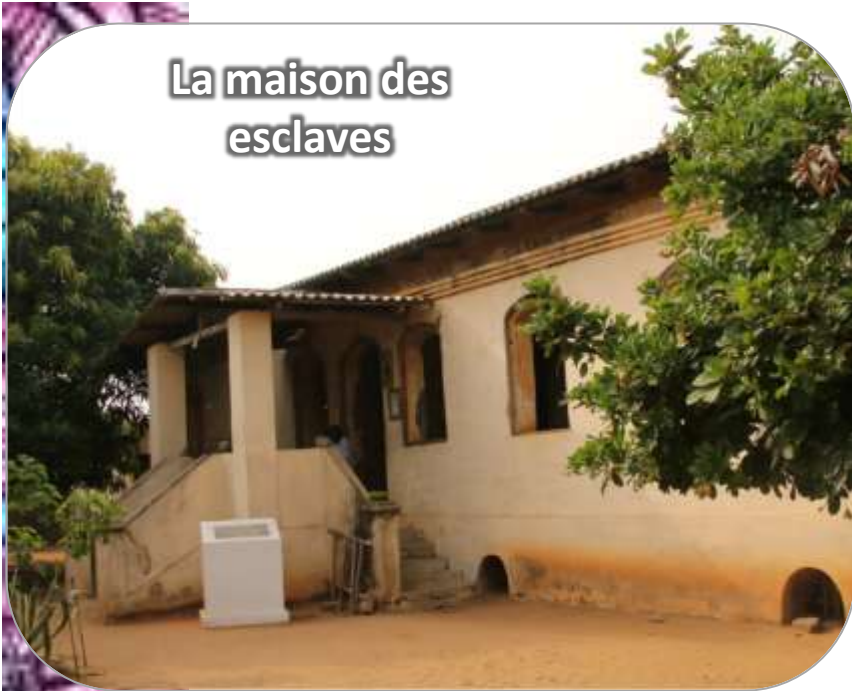
La maison des esclaves