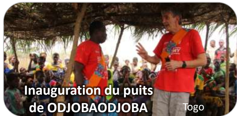
Inauguration du puits de ODJOBAODJOBA